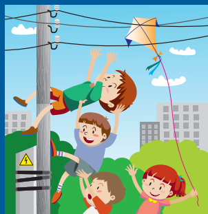
Нельзя играть вблизи линий электропередачи!