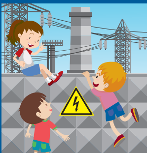
Не придумывай как достать или проникнуть! Позови взрослых!