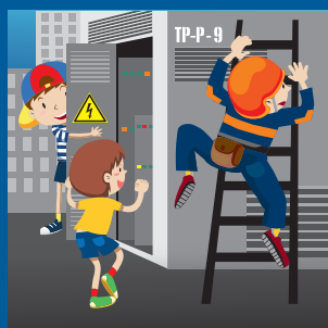
Нельзя открывать двери трансформаторных подстанций!