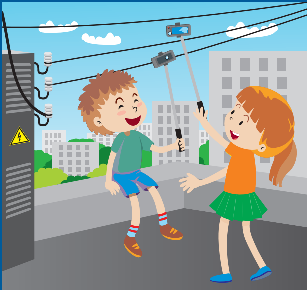
Нельзя использовать палку для селфи рядом с электрооборудованием и линиями электропередачи!

Обращаем ваше внимание на необходимость соблюдения правил поведения вблизи энергообъектов! Линии электропередачи и иные электроустановки – источник повышенной опасности! В зоне риска – наши дети! Энергетики убедительно просят вас, уделите пять минут и прочитайте вместе со своими детьми основные правила электробезопасности!