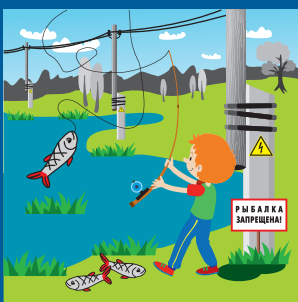
Нельзя ловить рыбу рядом с линией электропередачи!